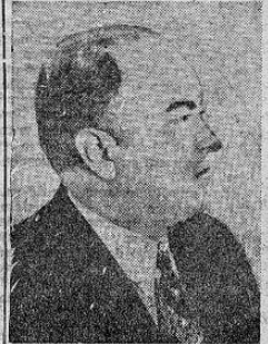
Chicago, Ill., 10.— Central America News.— En su carácter de Ministro de la Guerra, de Nicaragua, el General Anastasio Somoza ha hecho severa advertencia al Gobierno de Costa Rica, con motivo de haber sido violado el territorio nacional, diez veces por aviones costarricenses y una vez por una goleta denominada "Rio Grande", la cual fue inmediatamente perseguida por cazas aéreos nicaragüenses, los que hicieron fuego sobre dicha embarcación.

Es muy significativo el hecho de que el Ministro Somoza haya concretado acusación contra la compañía de aviones TACA, de argo histórico en Centro América, cuando dijo que si dicha empresa sigue presidiendo para lo que él calificó de "vuelos indeseados" el Gobierno de Nicaragua le cancelará su contrato, sin pérdida de tiempo.